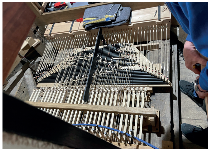
De afbouw van het laatste deel, het Rugwerk