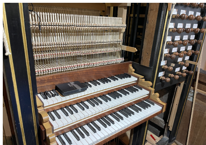
De drie klavieren (voor kenners: manualen) en het registerpaneel van het nieuwe orgel (TB)